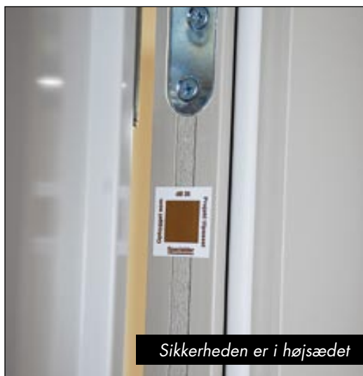
Sikkerheden er i højsædet