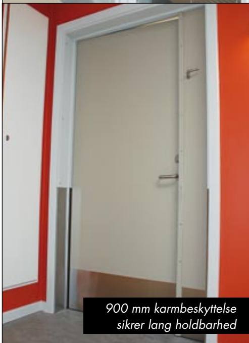
900 mm karmbeskyttelse sikrer lang holdbarhed